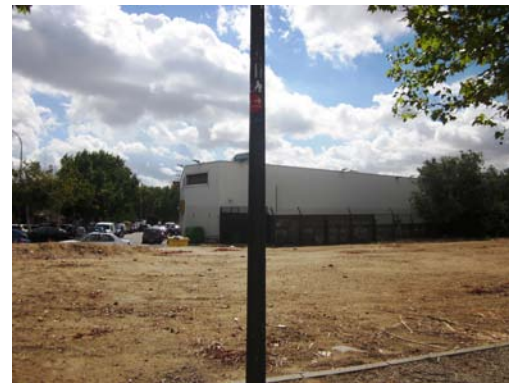
F-3 Repuesta y modificada