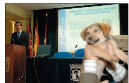
El gerente de Madrid Salud presentó los resultados de la adopción en 2005, en compañía de este cachorro.